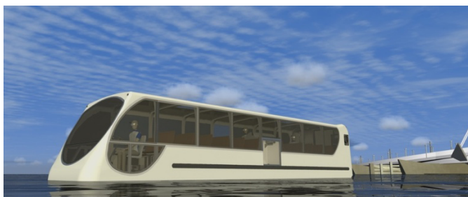
Amphibienbus der Dutch Amphibious Transport Vehicles B.V.

Basierend auf den Berechnungsergebnissen wurde die Zulassung durch den RDW erteilt. Auf zusätzliche Realtests des gesamten Busses konnte verzichtet werden.