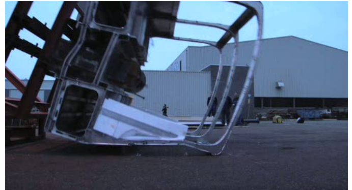
Realtest des Busumsturzes